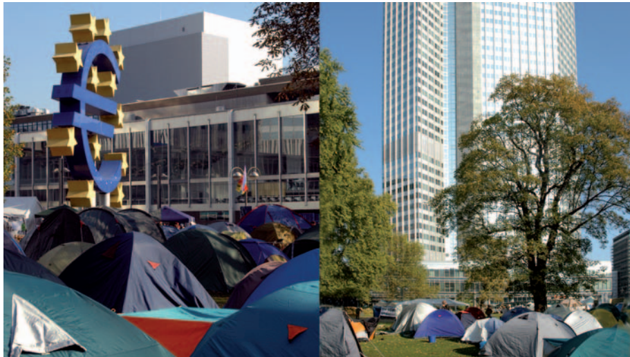
(Camp von Occupy Frankfurt vor der EZB)

345 Billionen – das sind 345 000 Milliarden oder 345 000 000 Millionen. Das sind in der Geschichte noch nie erreichte Dimensionen. Nennt man so etwas „Finanzkrise“?